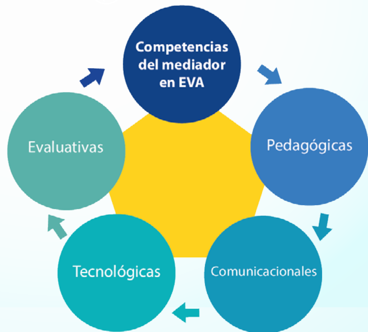
Figura 2. Competencias del mediador.

Para alcanzar el éxito en la docencia de los ambientes virtuales de aprendizaje, se requiere que el académico adquiera habilidades, destrezas, conocimientos y competencias ligadas a los aspectos pedagógicos, comunicacionales, tecnológicos y evaluativos que permitan la implementación de las buenas prácticas educativas. Entiéndase por competencias las formas de combinar recursos personales para realizar una tarea e ir más allá del saber y saber hacer o aplicar, Noriega (2012).