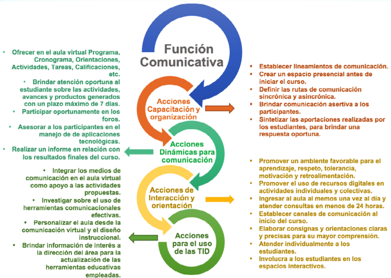
Figura 5. Función comunicativa en EVA.

En dicha función el docente virtual debe considerar una serie de lineamientos implicados para la mediación en un entorno de aprendizaje, donde la interacción entre el docente y el estudiante asume un papel preponderante para consolidar y fortalecer la participación, motivación, el aprendizaje individual y colectivo. Ante dicho escenario, se presenta en la siguiente figura una serie de acciones, tales como; capacitación y organización, dinámicas, interacción, orientación y uso de las TIC (González et al. 2012).