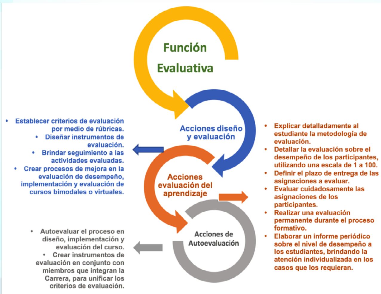
Figura 6. Función evaluativa en EVA.

El docente virtual ante dicha función debe considerar una serie de elementos que componen el sistema evaluativo en el marco de los ambientes de aprendizaje, ya que este debe responder al diseño curricular de los mismos en cuanto a estrategias didácticas, enfoque pedagógico y los criterios de valoración para los contenidos. De esta manera, asume desde su accionar actividades como el diseño y planeamiento de la evaluación, evaluación del aprendizaje y la autoevaluación durante el proceso (González et al. 2012).