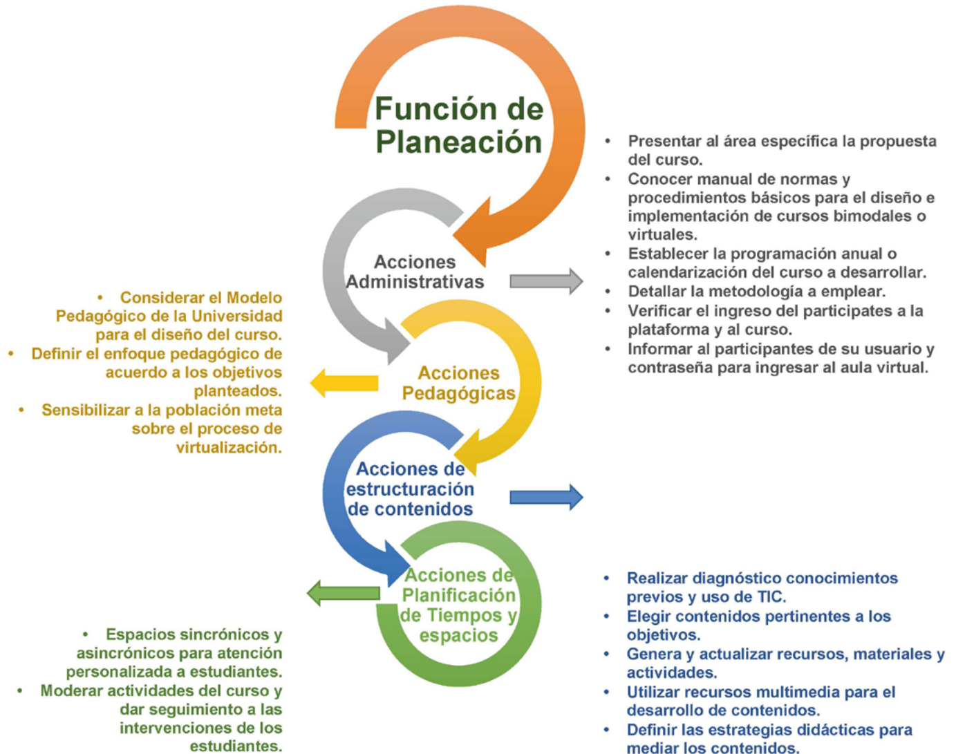
Figura 4. Función de planeación en EVA.