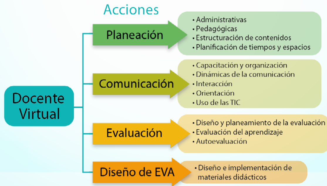
Figura 3. Docente en EVA.

A continuación, se presenta en el siguiente esquema los roles del docente en los ambientes virtuales de aprendizaje como elementos claves para el uso de las buenas prácticas educativas.